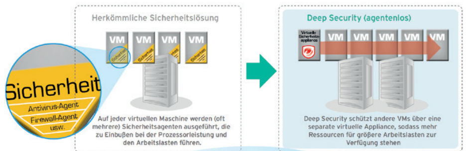
Schutz durch virtuelle Appliance

Deep Security bietet erweiterten Schutz für physische, virtuelle und cloudbasierte Server. Die Lösung schützt Unternehmensanwendungen und Daten vor Datenschutzverletzungen und Unterbrechungen des Geschäftsablaufs und macht Notfall-Patching überflüssig. Mit dieser umfassenden und zentral verwalteten Plattform vereinfachen Sie die Verwaltung sicherheitsrelevanter Vorgänge, erfüllen Auflagen zur Compliance und beschleunigen den ROI von Virtualisierungs- und Cloud-Projekten.